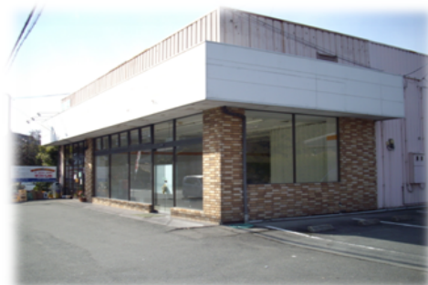
宇土市戸口町堂の前30-1