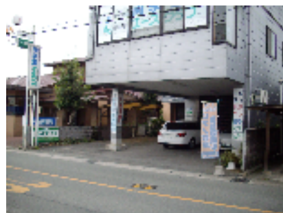
菊池市泗水町薬師3514